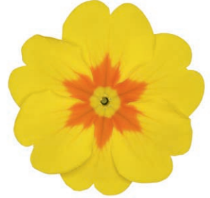
eblo ® gelb mit Auge