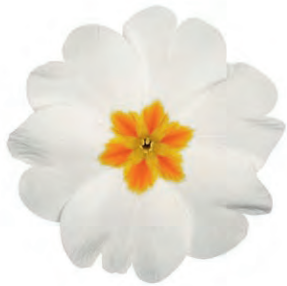
eblo ® weiß mit Auge