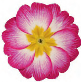
eblo® elcora rosa