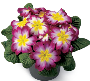
elunistar ® elcora karmin