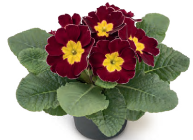
elunistar ® weinrot