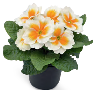
elunistar ® buttercream