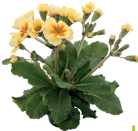
stella ® creme mit Auge