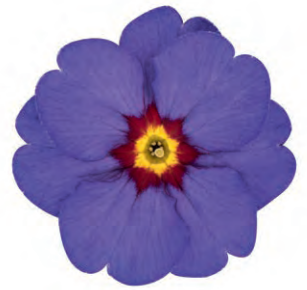
eblo® blau Rotauge