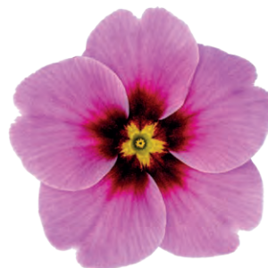
eblo ® lavendel