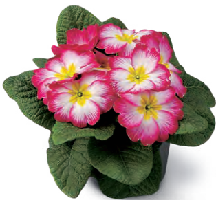
elunistar ® elcora rosa