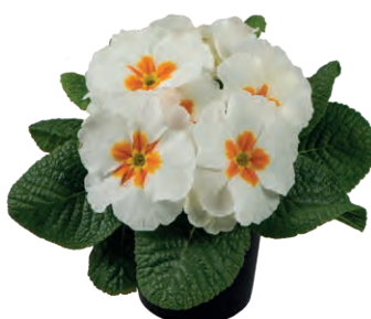
elunistar ® weiß mit Auge