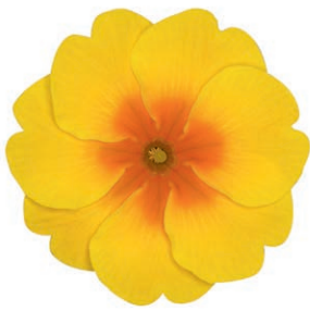
eblo® goldgelb mit Auge