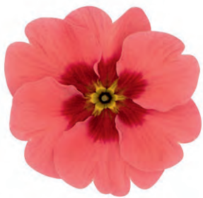
eblo ® himbeere