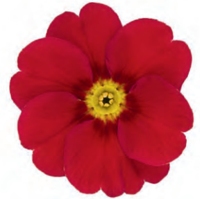
eblo ® rot Rotauge