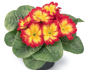
elunistar ® elcora rot