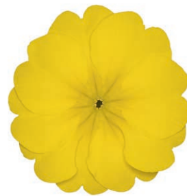
eblo ® gelb-zitrone