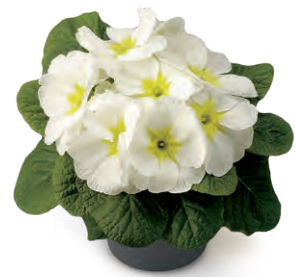
elunistar ® weiß-grün