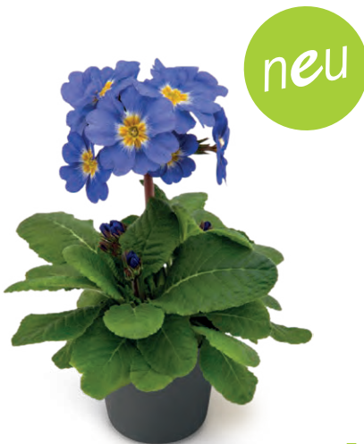
sibel ® elcora blau