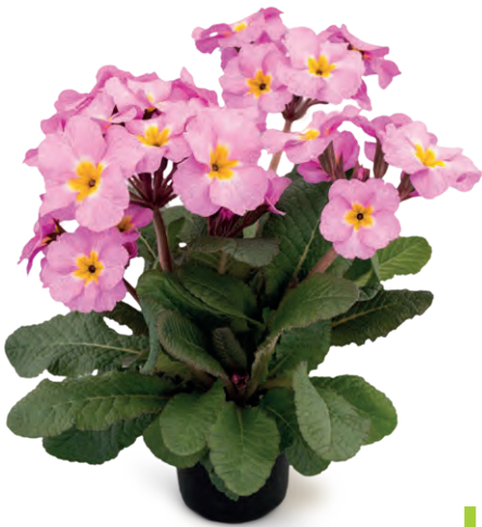
stella ® flieder