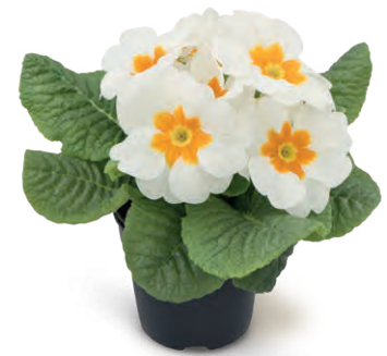
gelaya weiß mit Auge