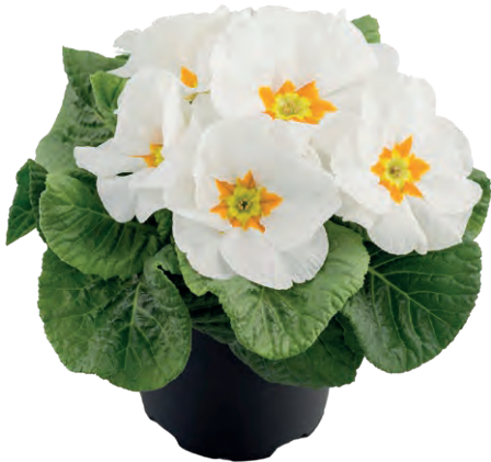
aurela weiß mit Auge