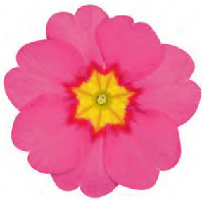
eblo® rosa Rotauge