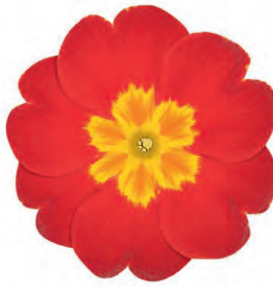
eblo ® rot