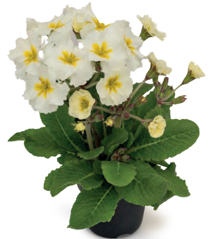
stella ® weiß