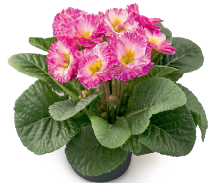
elodie elcora rosa