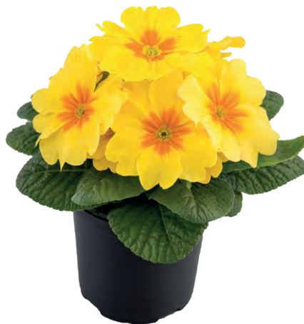
aurela gelb mit Auge