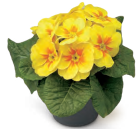
fruelo® gelb mit Auge