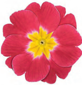
eblo ® rosa