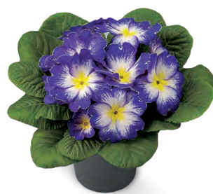
elunistar ® elcora blau