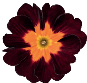
eblo® bloody mary