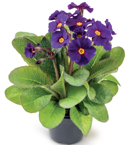
stella ® blau

Viele Blüten, die sich auf langen Stielen über den dunkelgrünen Blättern tummeln. Als Polyantha-Typ ist stella ® die richtige Wahl für Primelfreunde, die Originelles schätzen. Die ab Anfang März blühende Primel hat einen lockeren, sehr natürlich wirkenden Pflanzenaufbau. Ob zur Verwendung auf der Fensterbank, der Terrasse oder im Garten, die robuste, reichblühende stella ® wird im Handel und beim Konsumenten die Blicke auf sich ziehen.