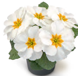
fruelo® weiß mit Auge