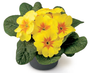
elunistar® gelb mit Auge