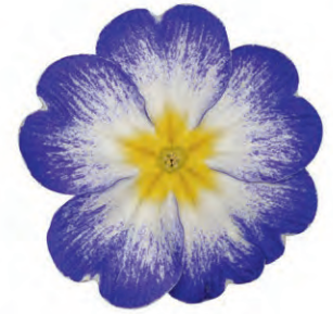
eblo® elcora blau