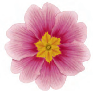
eblo ® apfelblüte